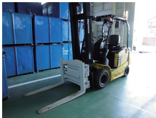
環境に配慮した電気リフト