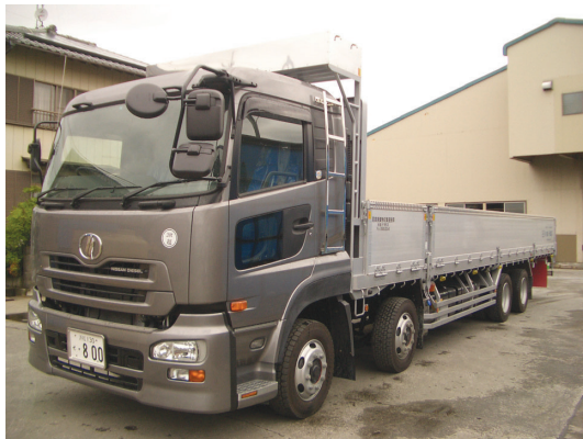
大型増トン車(平ボディ)

産業廃棄物収集運搬車両9台、一般廃棄物収集運搬車両3台、 4t車(セーフティーローダー1台、平ボディ2台、ユニック2台、パッカー2台)、 フォークリフト11台、大型増トン車(平ボディ)2台、ユンボ1台 他